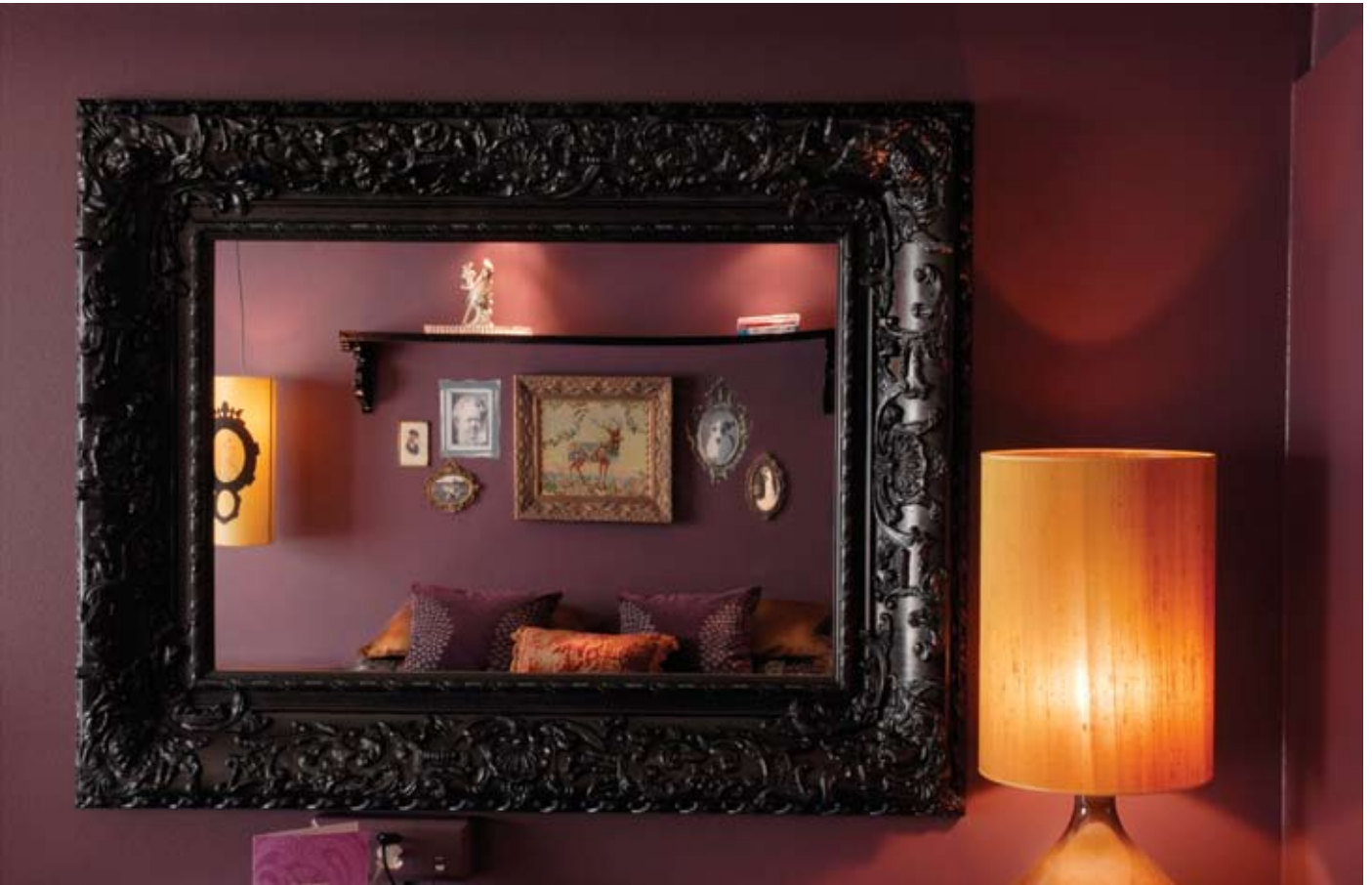
Mørkt og vakkert med originale detaljer på Ane Dahl Torps rom Arsenikk & gamle kniplinger. Designet av Karina Holmen, Eske